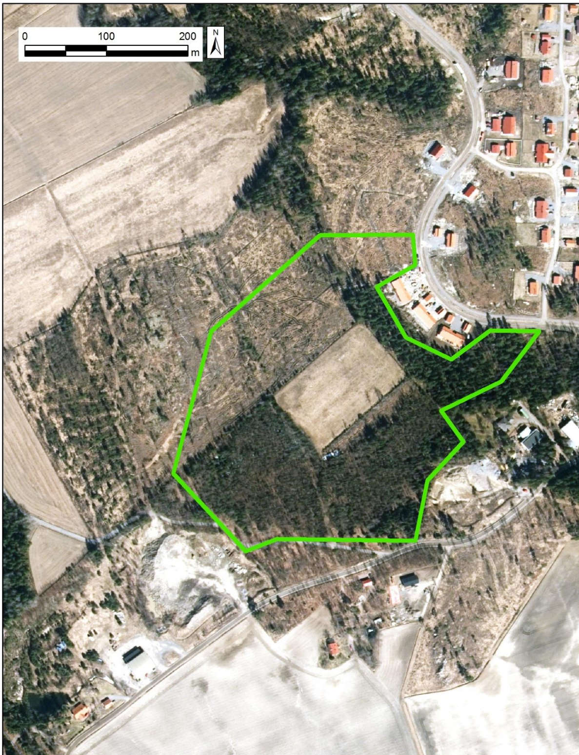
Kuva 2. Siuntion Virkkulankylän hankealueen rajaus (ilmakuvapohja).